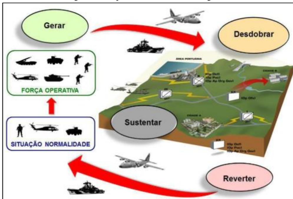
Figura 2 - Capacidades básicas da Logística