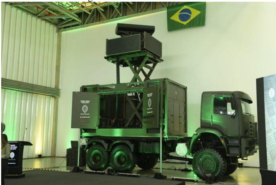
Figura 4 – Radar SABER M200

O SABER M200 MM (Figura 4) é um radar brasileiro projetado para Sistemas de Defesa Antiaérea de Média Altura, composto por dois radares independentes: o primário (Radar P200) e o secundário (Radar S200D). Este radar, definido por software , pode realizar diversas funções, como busca, vigilância, direção de tiro e controle de tráfego aéreo (Barros, 2015).