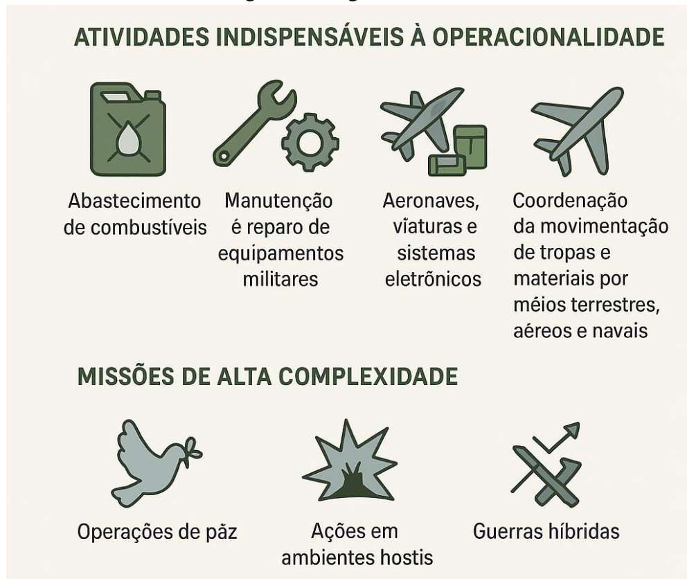
Figura 1 – Logística Militar