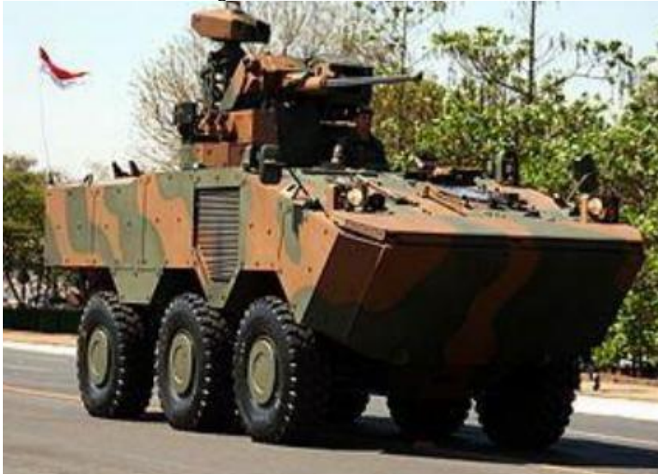
Figura 5 - VBTP MR-Guarani