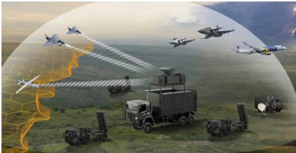
Figura 9 - Radar Embraer M200 Multi-Mission

A expansão da Embraer também envolve parcerias internacionais, como a formação da empresa Harpia, em conjunto com a israelense AEL Sistemas, especializada em VANTs para vigilância e ataque, ampliando as capacidades tecnológicas e operacionais do setor nacional (Vianello, 2016). Tais parcerias possibilitam não só o avanço técnico, mas também a atração de investimento estrangeiro direto, transferência de tecnologia e inserção do Brasil em cadeias produtivas globais. O setor de comando e controle, por ser altamente intensivo em pesquisa e desenvolvimento (P&D), promove ainda geração de empregos qualificados e desenvolvimento de polos industriais, como o de São José dos Campos (Vianello, 2016).