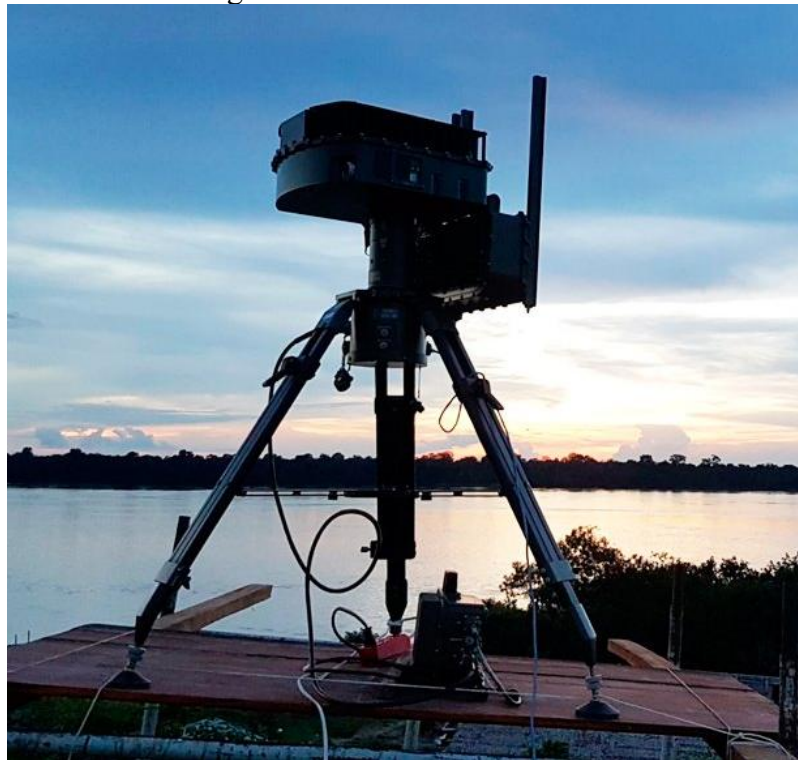
Figura 10 - Radar SENTIR M20