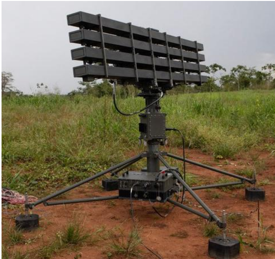
Figura 8 - Radar SABER M60