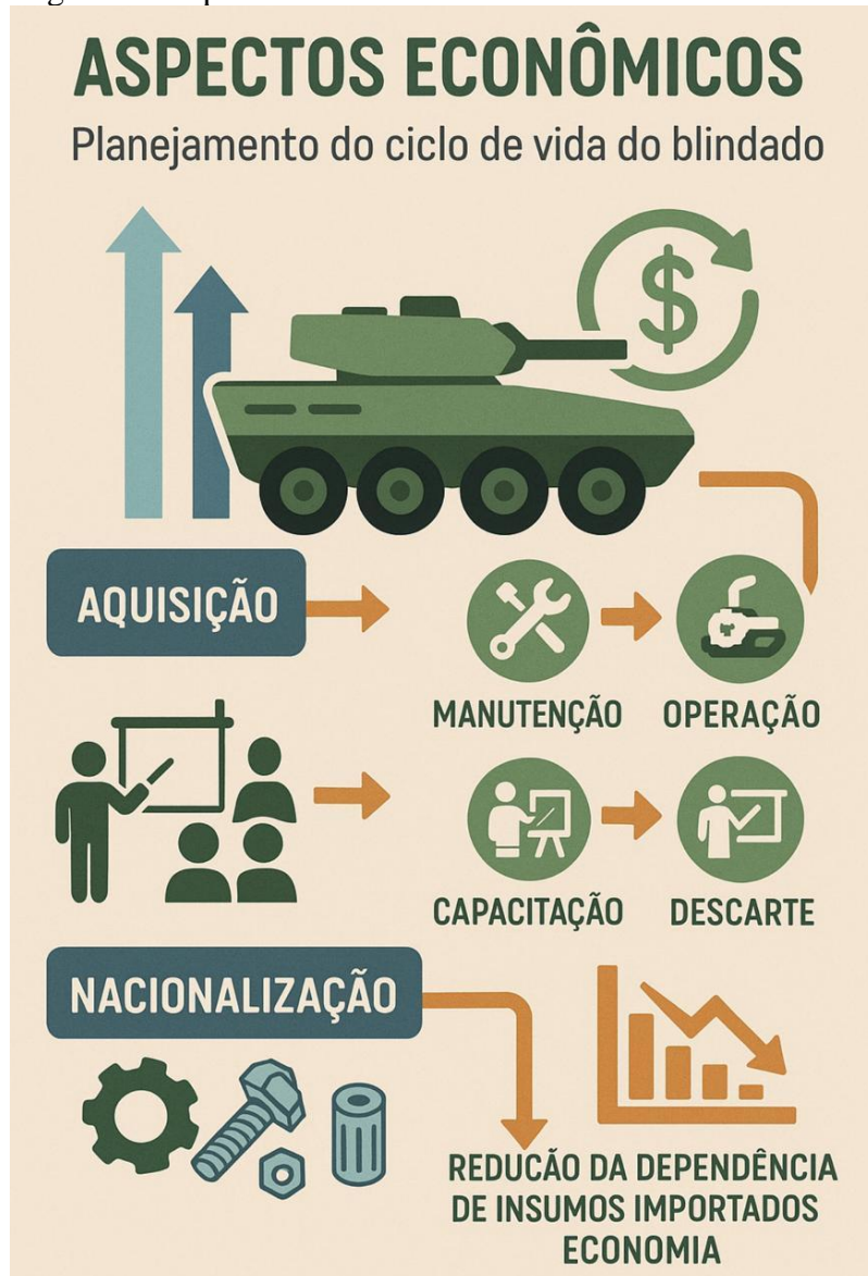
Figura 6 - Aspectos econômicos do ciclo de vida do blindado