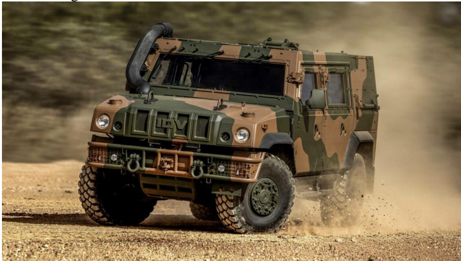
Figura 7 - Viatura blindada multitarefas IDV Guaicurus

O Veículo Guaicuru representa mais um passo significativo na modernização das capacidades operacionais do Exército Brasileiro, especialmente no contexto da Cavalaria Mecanizada. A nova versão da viatura blindada leve multitarefa ( Light Multirole Vehicle – LMV ), designada como LMV-BR 2, apresenta melhorias substanciais em relação à sua antecessora, com maior capacidade de carga e conforto para os ocupantes. O modelo pode transportar até cinco militares, incluindo o condutor, e foi projetado para atuar em missões de reconhecimento, patrulhamento e escolta em terrenos variados, com alto grau de proteção balística e contra explosivos (Rodriguez, 2024).