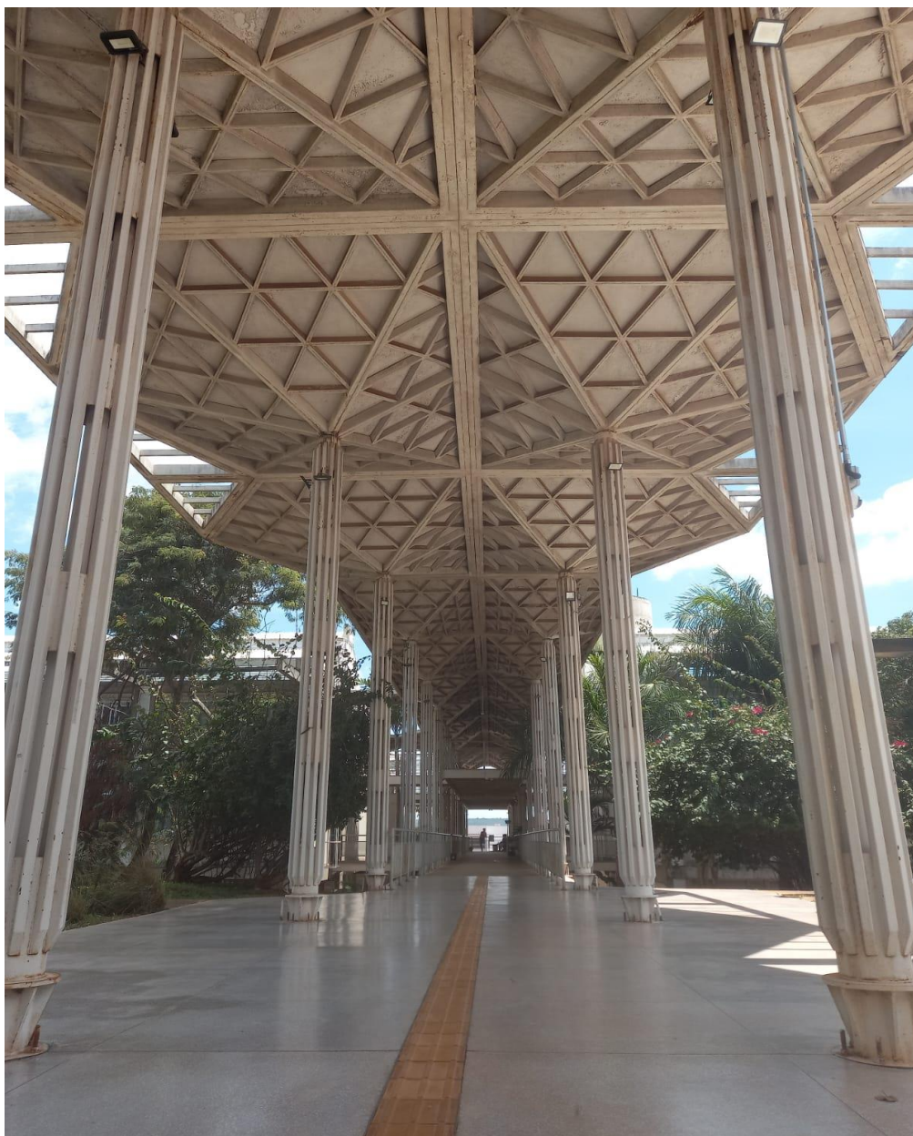
Estrutura do Prédio de Biologia da Universidade de Brasília